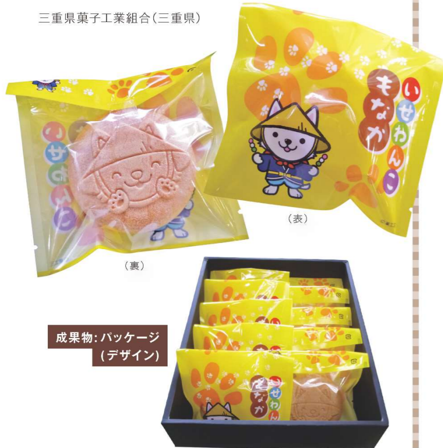
成果物: パッケージ (デザイン)