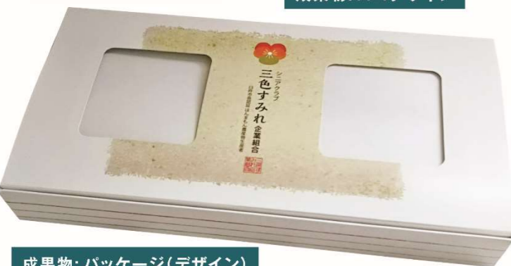
成果物: パッケージ(デザイン)