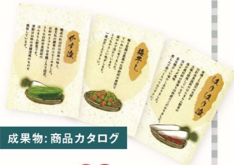
成果物: 商品カタログ