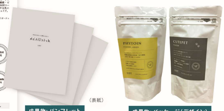
成果物: パンフレット