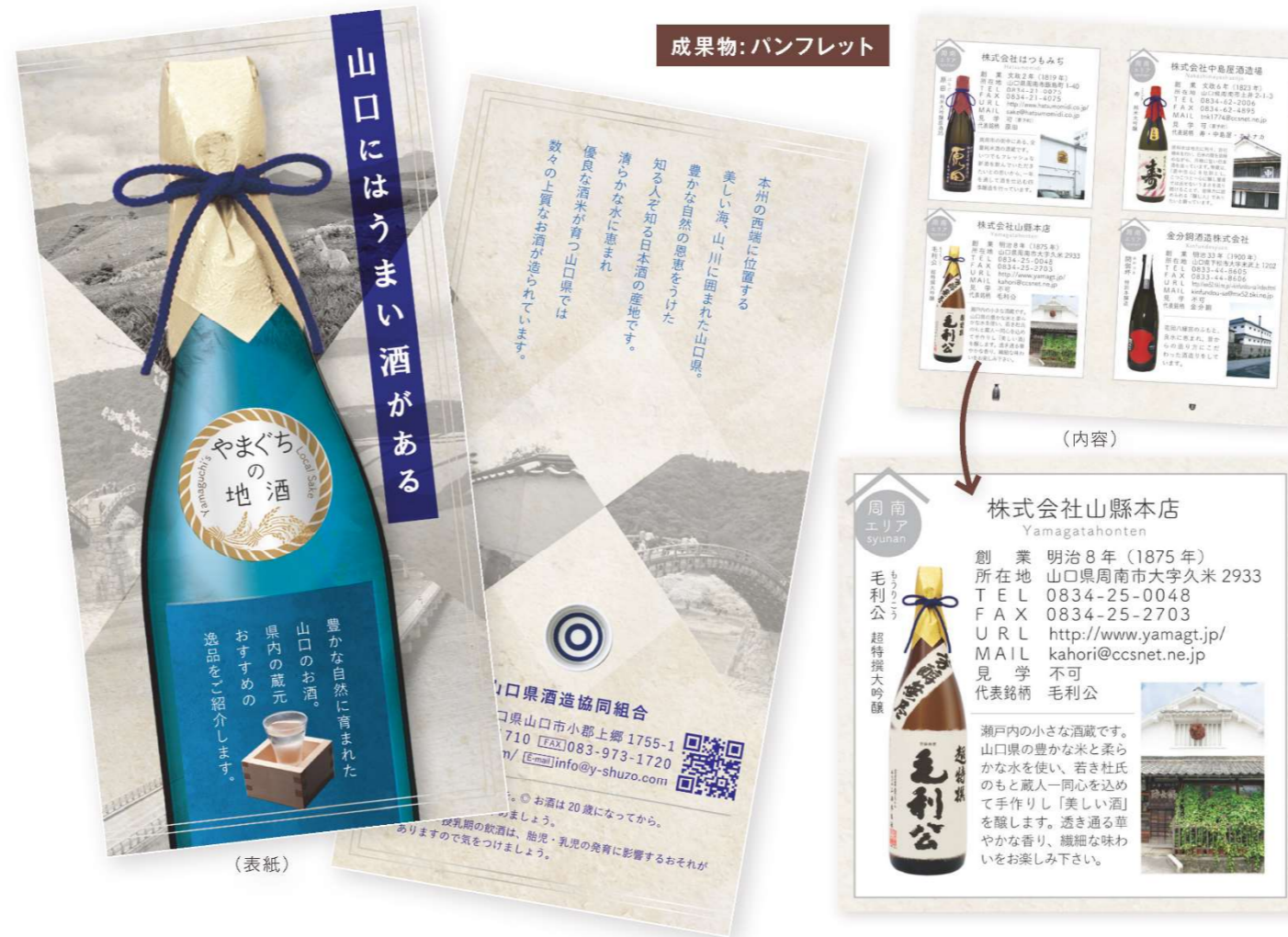
成果物: パンフレット