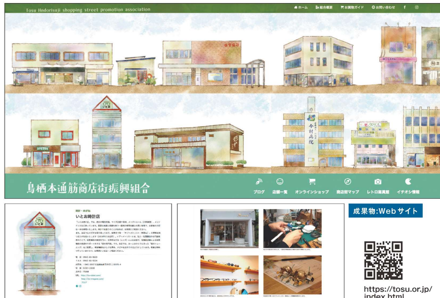
鳥栖本通筋商店街振興組合