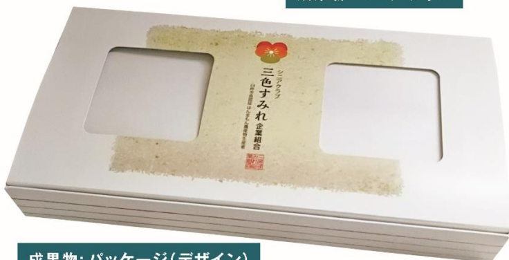
成果物: パッケージ(デザイン)