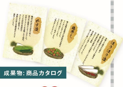
成果物: 商品カタログ