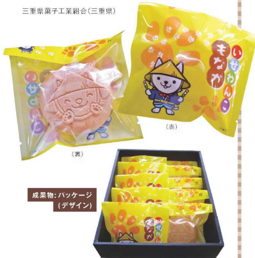
成果物: パッケージ (デザイン)